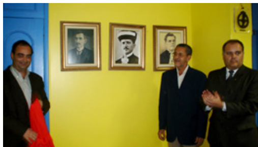
Galeria de Fundadores do IHGES.