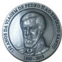
Medalha Pedro II

Para perenizar a passagem do sesquicentenário da visita de D. Pedro II ao Espírito Santo em 1860 foi cunhada a medalha comemorativa, a terceira mandada cunhar na atual gestão do IHGES. Exemplares da medalha foram encaminhados a instituições culturais.